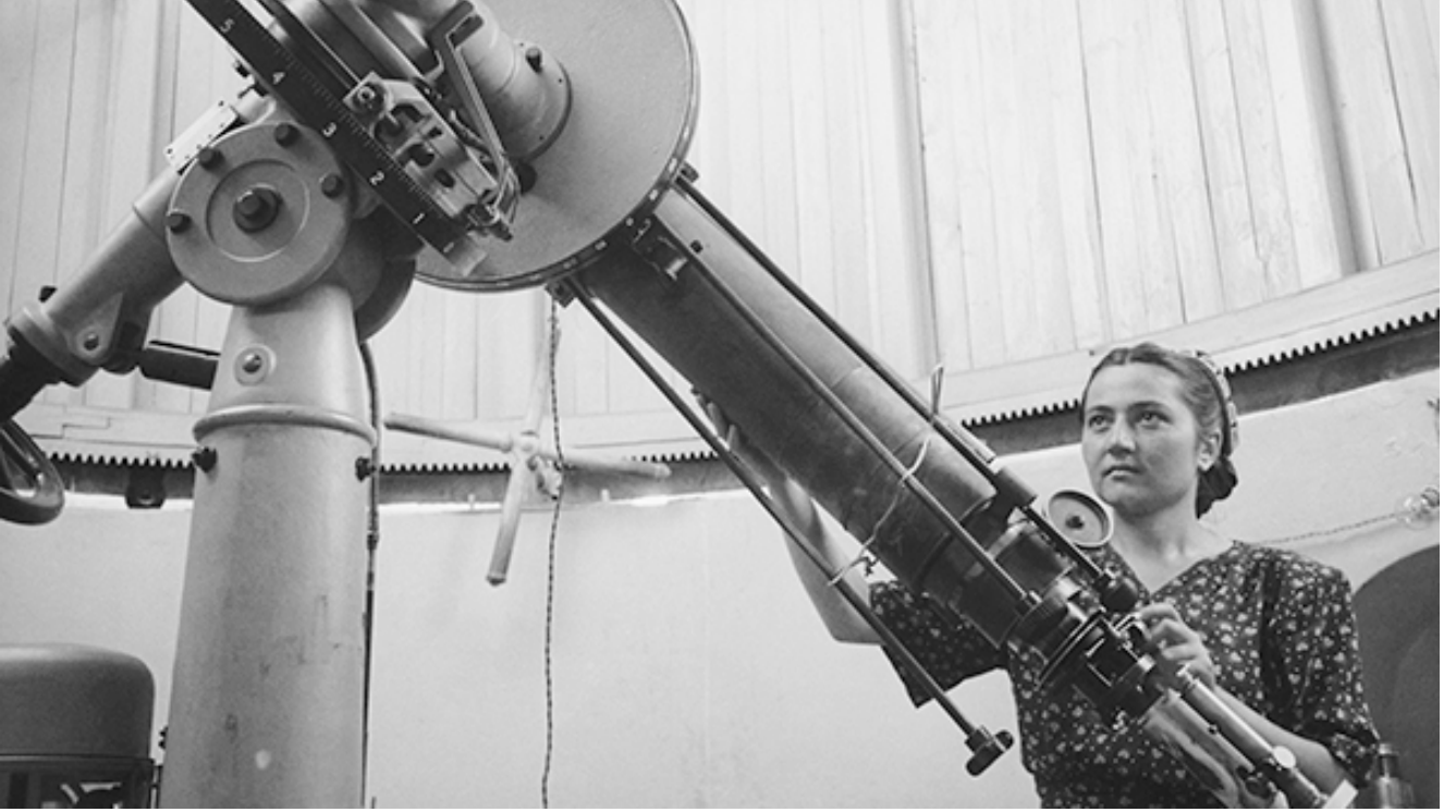
Cecilia Payne, bizi yıldızların doğası ile tanıştırdı.

İlk tayf ölçümü, yıldızların Yeryüzü'nde de var olan maddeleri içerdiklerinin ilk kanıtını sağlamıştır. Tayf ölçümü, bazı bulutsuların yıldız içeriyor olmalarına rağmen, bazılarının sadece gazdan oluştuğunu ortaya çıkarmıştır. Bu bilgi, daha sonra bazı bulutsuların bulutsu değil farklı galaksiler olduğu fikrini sağlamlaştırmaya yardımcı olmuştur.